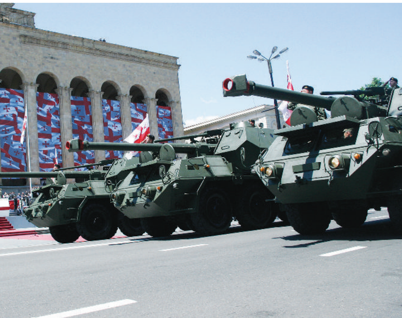
152-мм самоходные пушки-гаубицы из ЕС