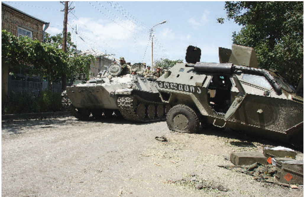
Подбитая грузинская бронетехника в Цхинвале. 2008 г.