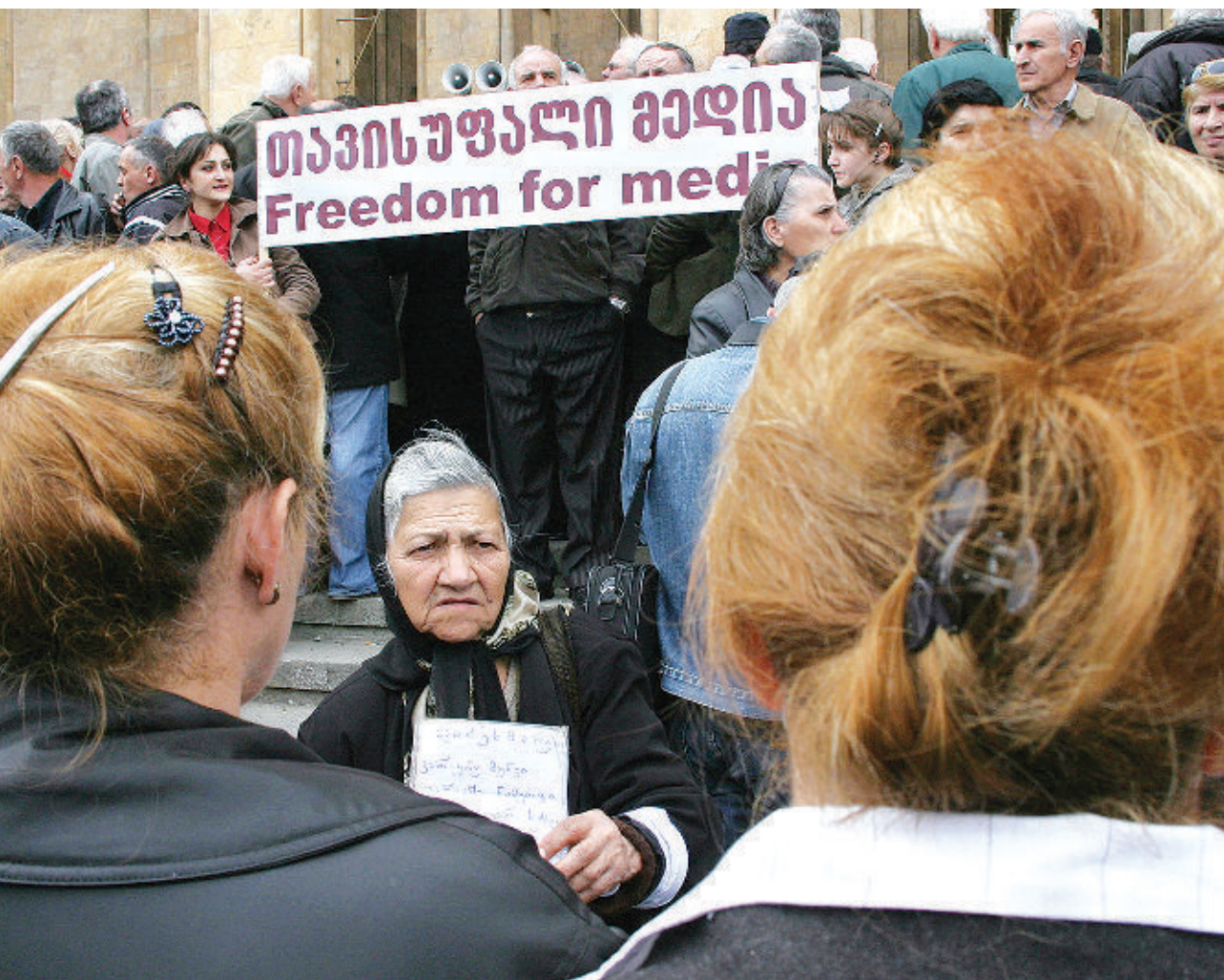
Одно из требований демонстрантов на митинге протеста в 2008 г. — свобода слова