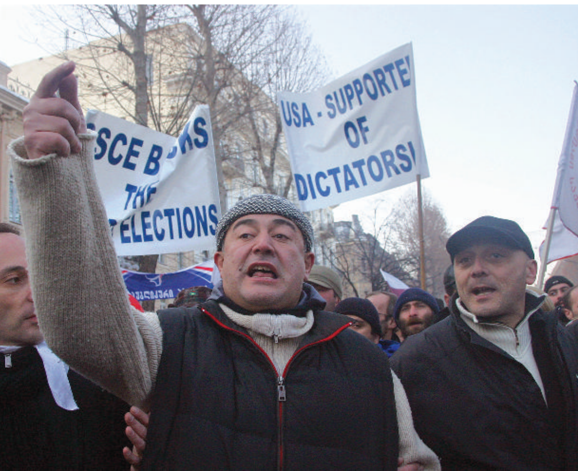
Плакат с митинга протеста с надписью: «США поддерживают диктаторов»