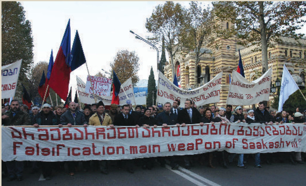
Участники митинга протеста, организованного партией лейбористов в 2007 г., несут транспарант с надписью: «Фальсификации — основное оружие Саакашвили»