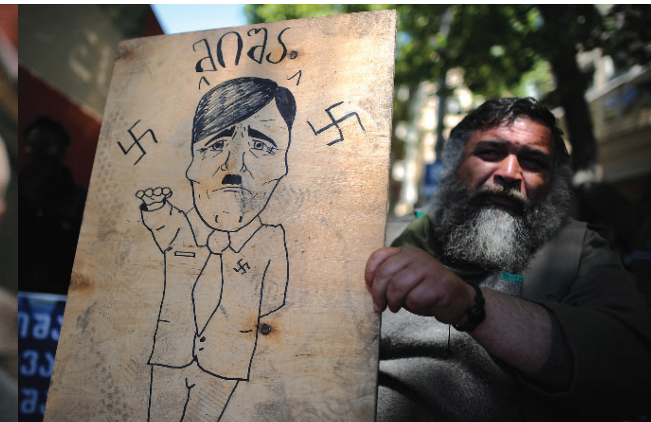
Самодельный плакат с митинга оппозиции в 2011 г.