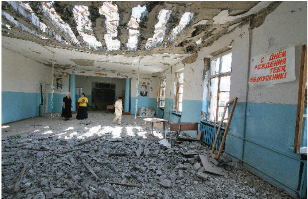
Разрушенная грузинскими реактивными системами залпового огня школа в г. Цхинвал