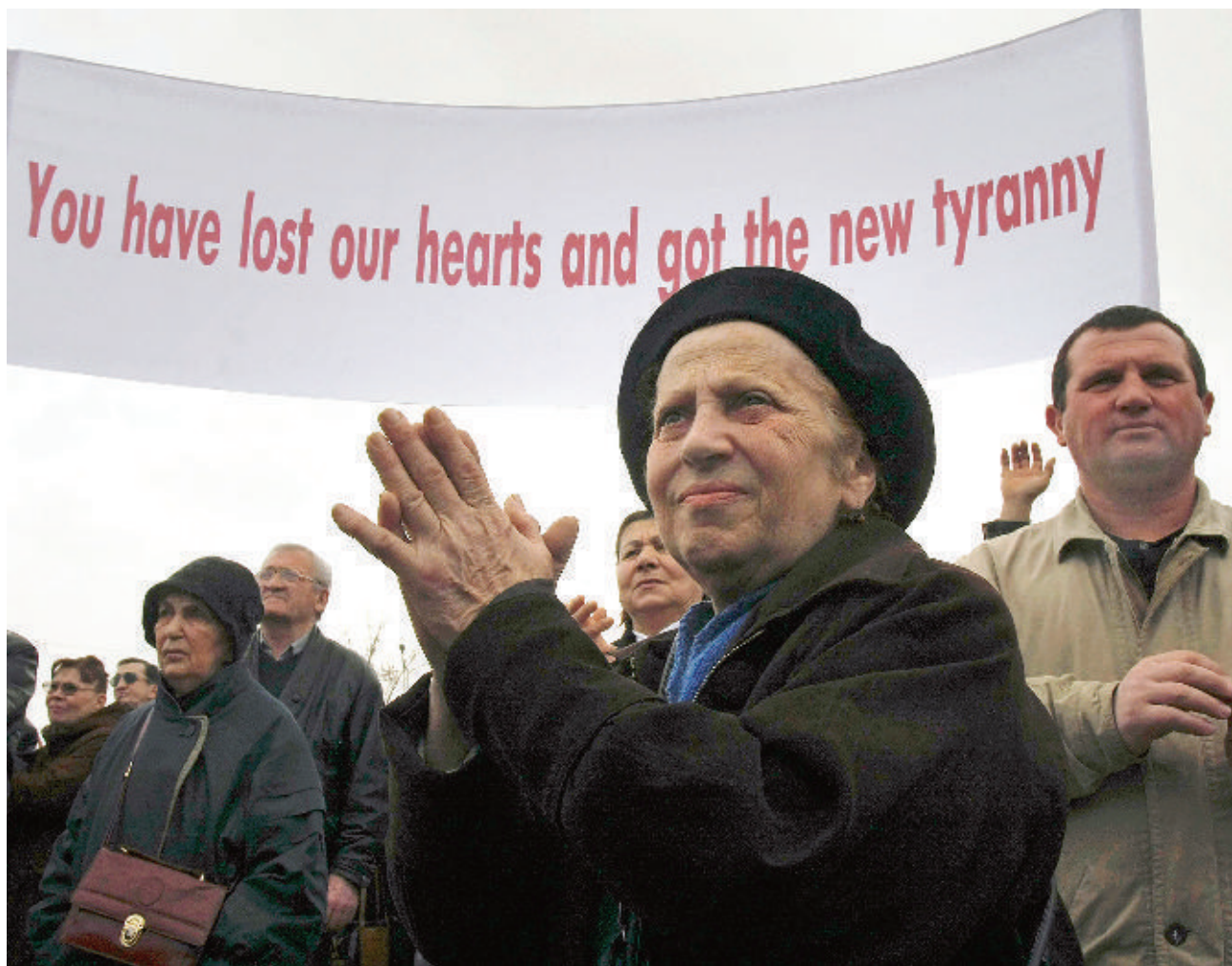
Транспаранты на митингах протеста против встречи Дж. Буша и М. Саакашвили. Надписи о «новой тирании», выполненные по-английски, не смогли изменить мнение властей США о режиме Михаила Саакашвили