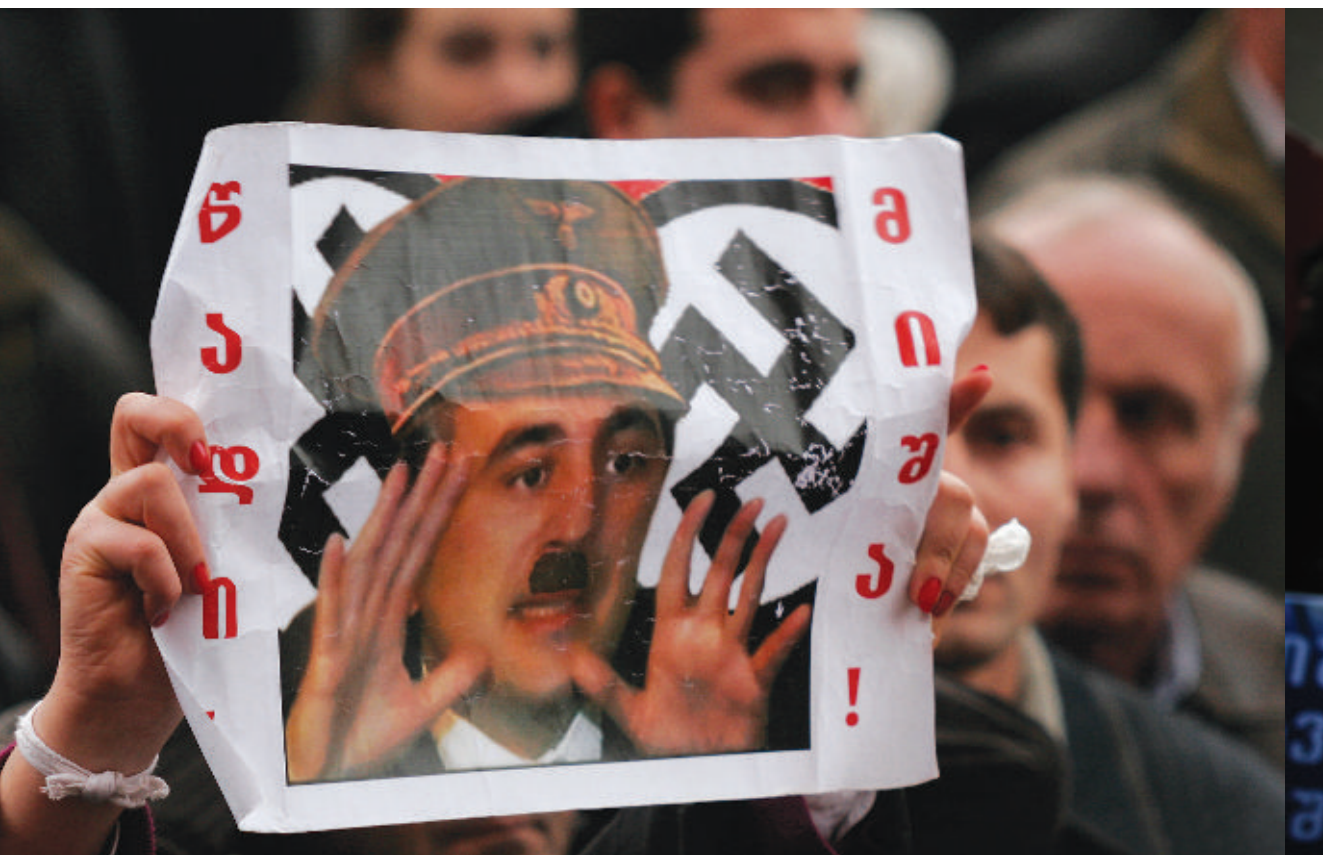
Самодельный плакат с митинга оппозиции в 2007 г.