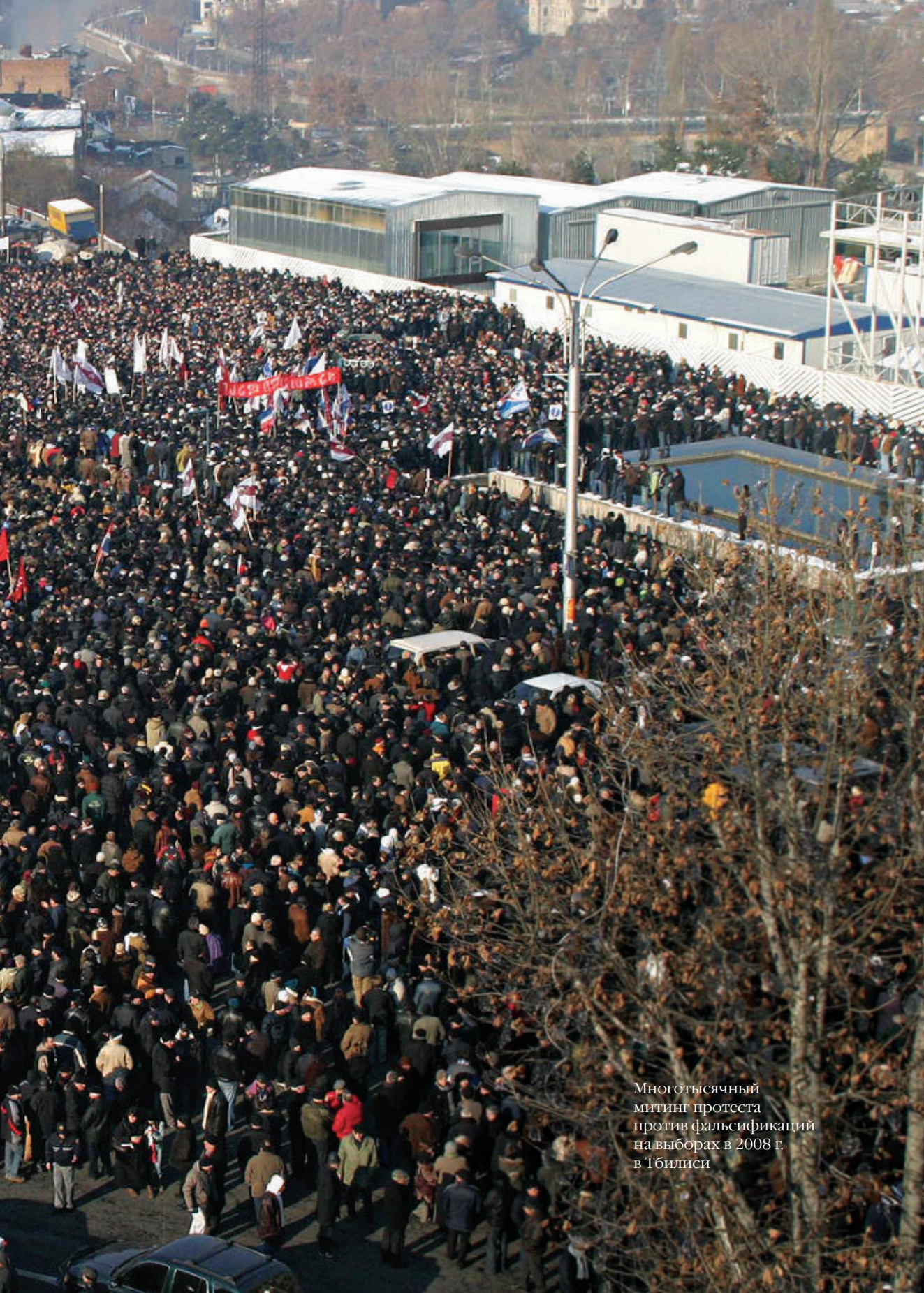
Многотысячный митинг протеста против фальсификаций на выборах в 2008 г. в Тбилиси