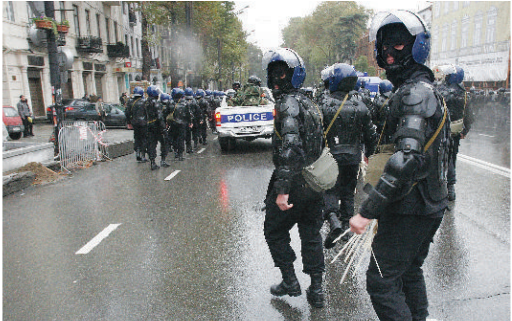
Полиция готовится к массовым арестам — в руках полицейских пластиковые наручники