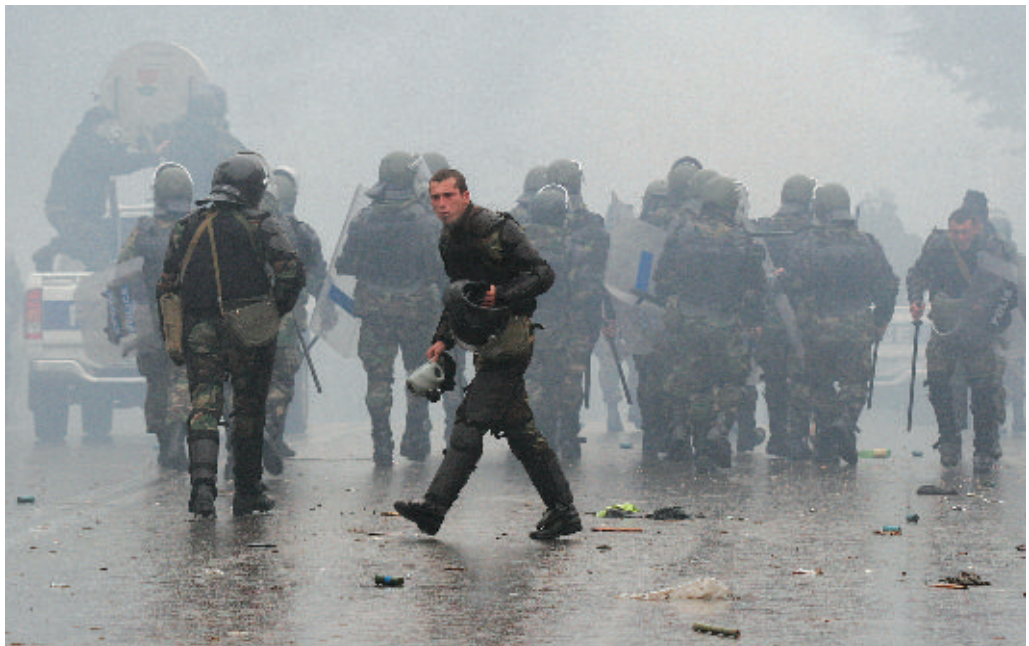
На снимке — автомашина со специальной акустической пушкой LRAD, новейшим устройством для разгона демонстраций производства American Technology Corporation